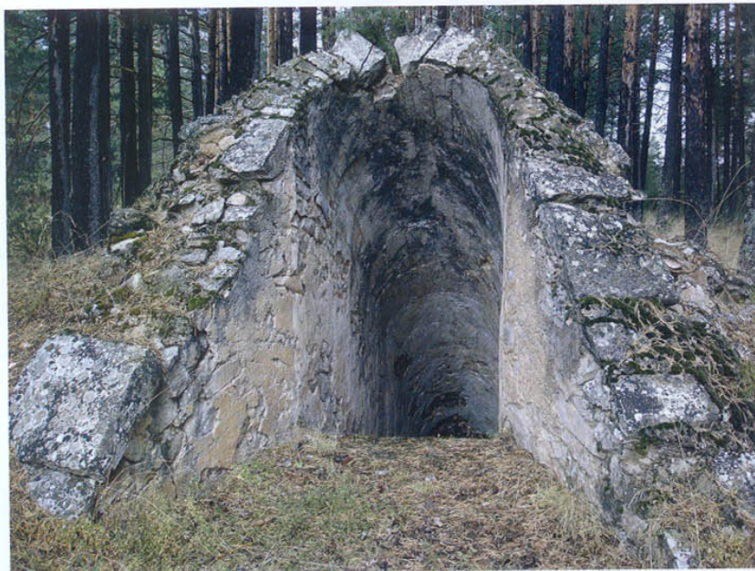
Acceso a refugio Anti-aéreo en aeródromo republicano