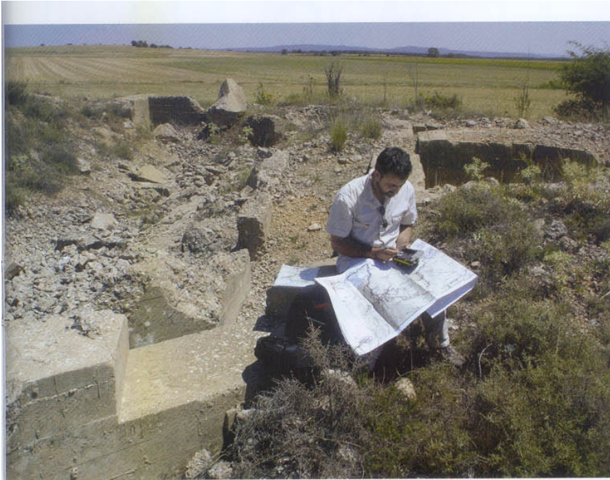
Trabajo de campo del Colectivo Guadarrama

ca y paneles históricos, y en esa función estamos ayudándoles mediante la catalogación anteriormente descrita. También Quijorna, en cuyo término municipal se encuentra la primera casamata nacional de la que hablábamos antes, se ha planteado reactivar los caminos rurales de forma similar. Con Brunete colaboraron miembros del CG en su día, a título particular, y el ayuntamiento de Guadalajara va a contar con nosotros para que nos hagamos cargo de la parte histórica y