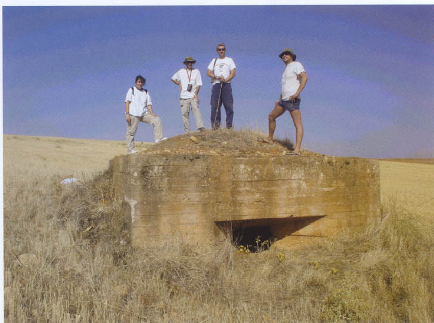
Miembros del Colectivo Guadarrama sobre nido de ametralladoras republicano

como en las estribaciones del Alto Tajo. Los resultados fueron espectaculares. Más de 150 puntos singulares con trincheras, puestos de tirador, observatorios, nidos de ametralladora, refugios subterráneos y toda clase de elementos constructivos procedentes de nuestra pasada guerra. Se cubrieron cientos de kilómetros, localizándose los más destacados emplazamientos de las Divisiones 73, 74 y 75 nacionales, y 12, 14, 17 y 33 republicanas. En octubre se presentó el trabajo a la Junta, que lo recibió con satisfacción y sorpresa, ya que no se imaginaban tal concentración de restos recogidos en un trabajo que se desarrolló en apenas tres meses. Además el pro-